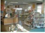
BU Centrale Batna 1

...ليس لديكم فكرة للبحث، أدخل إلى المكتبة